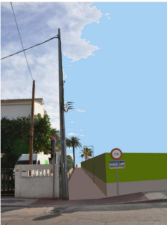
IMAGEN APERTURA VIAL PROPUESTA PLAN DE REFORMA INTERIOR (Se mantiene la palmera)