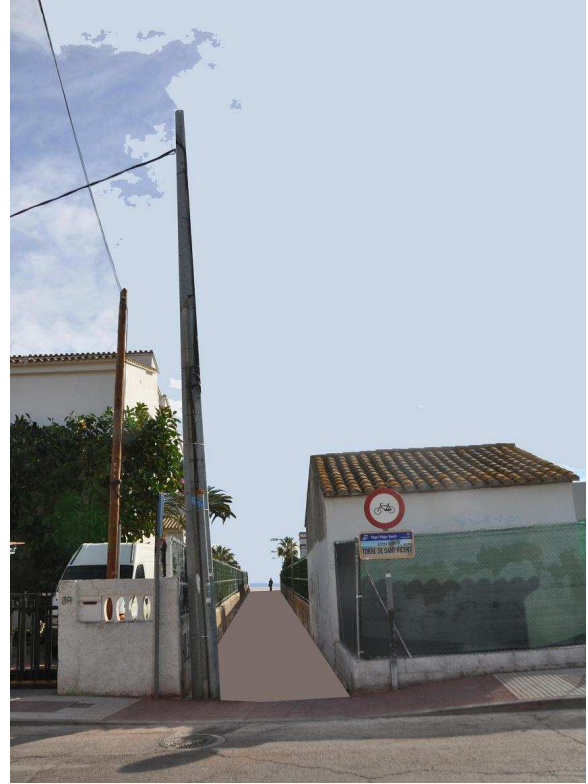
IMAGEN APERTURA VIAL PLAN GENERAL (Desaparece Palmera al fondo del vial)