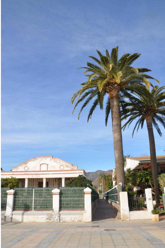
IMAGEN ACTUAL DESDE BERNAT ARTOLA