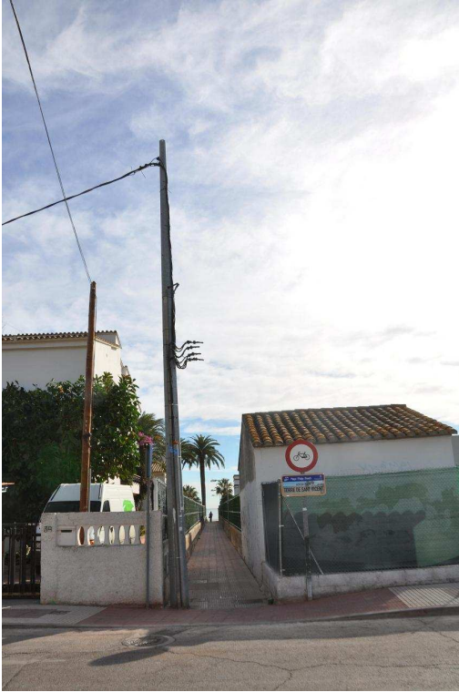
IMAGEN ACTUAL DESDE CALLE LA CORTE